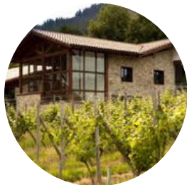
Señorio de Astobiza