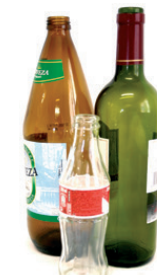
Beirazko botilak / Botellas de vidrio

EL RESTO AL CONTENEDOR GRIS ERREFUSA EDUKIONTZI GRISERA