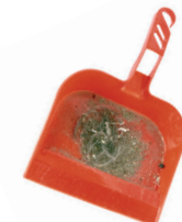
Errazte-hondarrak / Restos de barrido