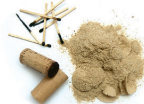
Kortxoak, zerrautsa, eta pospoloak / Corchos, serrín y cerillas