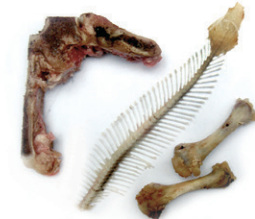
Haragi eta arrain hondarrak / Restos de carne y pescado