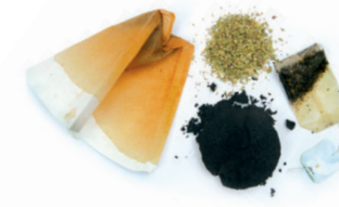
Kafe eta infusio hondarrak / Marro del café y restos de infusiones