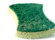
Espartzua / Estropajo