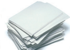
Papereko orriak / Hojas de papel