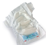
Pixoihalak eta konpresak / Pañales y compresas