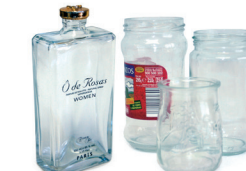
Beirazko ontziak / Tarros de vidrio

Recicla el vidrio sin tapas ni tapones Birziklatu beira, tapa eta tapoirik gabe