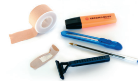
Besteak / Otros