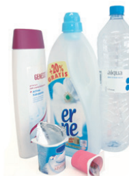
Plastikozko ontziak / Envases de plástico