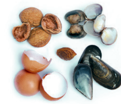
Arrautza eta marisko oskolak, fruitu lehorrak / Cáscaras de huevo, frutos secos y marisco