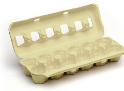
Kartoizko arrautza-ontziak / Hueveras de cartón

LOS ENVASES DE VIDRIO, AL VERDE BEIRAZKO ONTZIAK BERDERA