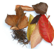
Lorategi edo baratze hondarrak / Restos del jardín o de la huerta

LOS ENVASES LIGEROS, AL AMARILLO ONTZI ARINAK EDUKIONTZI HORIRA