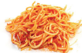
Sukaldatutako janaria (pasta, arroz, ...) / Comida cocinada (pasta, arroz...)