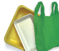
Porexpaneko erretiluak eta plastikozko poltsak / Bandejas de porexpan y bolsas de plástico