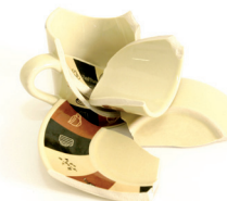
Zeramika hondarrak / Restos de cerámica

Productos que no se pueden reciclar Birziklatu ezin diren produktuak