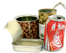
Latak / Latas

Recicla los envases quitándoles el aire para reducir el volumen Birziklatu ontziak, airea kenduta, bolumena txikitzeko