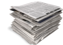
Egunkariak eta aldizkariak / Periódicos y revistas