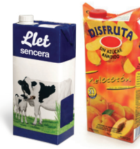
Brikak / Bricks

LOS ENVASES DE PAPEL Y CARTÓN, AL AZUL PAPERA ETA KARTOIZKO ONTZIAK URDINERA