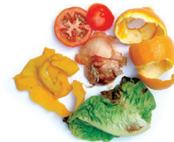
Barazki eta fruta hondarrak / Restos de fruta y verdura

Recicla la orgánica usando siempre bolsas compostables Birziklatu organikoa, beti poltsa konpostagarriak erabiliz