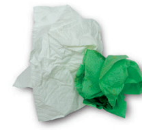
Sukaldeko papera eta musuzapiak / Papel de cocina y servilletas