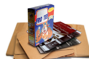
Kartoizko kaxak eta ontziak / Cajas y envases de cartón

Recicla el papel y cartón bien plegado y sin bolsas de plástico Birziklatu papera eta kartoia, ongi tolestuta eta plastikozko poltsarik gabe