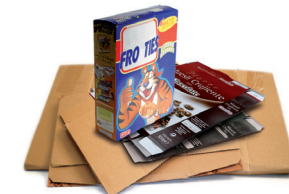
Kartoizko kaxak eta ontziak / Cajas y envases de cartón

Recicla el papel y cartón bien plegado y sin bolsas de plástico Birziklatu papera eta kartoia, ongi tolestuta eta plastikozko poltsarik gabe