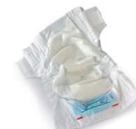
Pixoihalak eta konpresak / Pañales y compresas