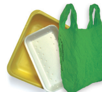
Porexpaneko erretiluak eta plastikozko poltsak / Bandejas de porexpan y bolsas de plástico