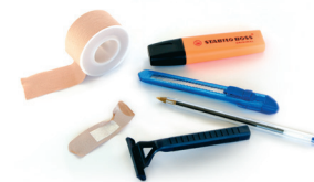
Besteak / Otros