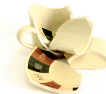
Zeramika hondarrak / Restos de cerámica

Productos que no se pueden reciclar Birziklatu ezin diren produktuak