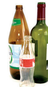
Beirazko botilak / Botellas de vidrio

EL RESTO AL CONTENEDOR GRIS ERREFUSA EDUKIONTZI GRISERA