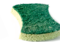
Espartzua / Estropajo