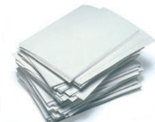
Papereko orriak / Hojas de papel