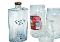
Beirazko ontziak / Tarros de vidrio

Recicla el vidrio sin tapas ni tapones Birziklatu beira, tapa eta tapoirik gabe