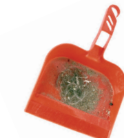
Errazte-hondarrak / Restos de barrido