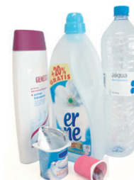
Plastikozko ontziak / Envases de plástico